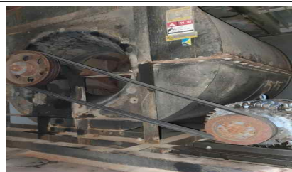
동양관 노후 급기휠