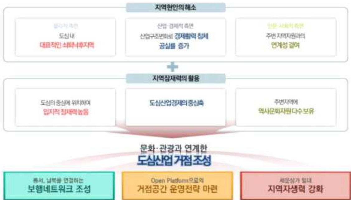
[ 세운상가 일대 도시재생활성화지역 재생방향 ]