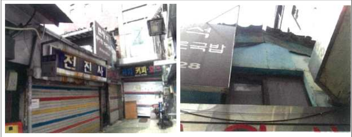
자료 : 서울시 역사도심 기본계획 부록 1, p.106