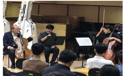
<'18.9.16. 첼로 마스터클래스>