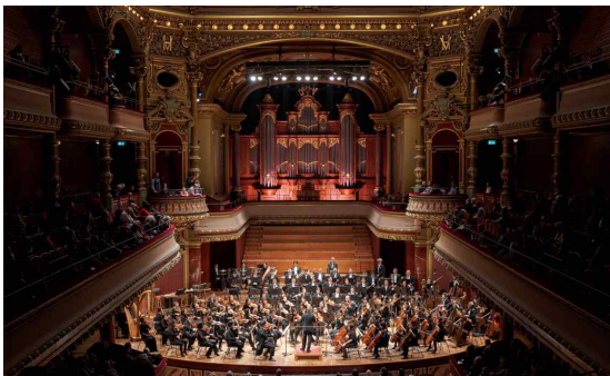
<2018.11.25. 스위스 제네바 연주>