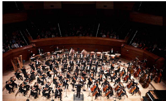
<2018.12.1. 프랑스 파리 연주>