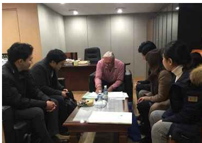
<'18.12.11 지휘 마스터클래스>