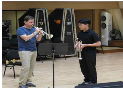
<'18.9.8. 트럼펫 마스터클래스>