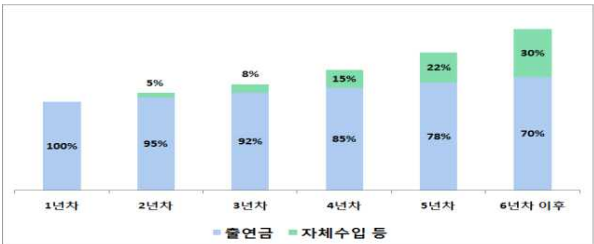
<그래프> 50플러스 재단 설립 이후 출연금과 자체수입 비중의 목표