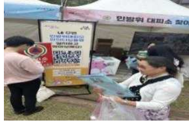
민방위대피소 찾아보기 홍보 부스