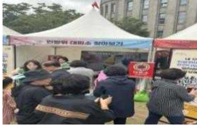
민방위대피소 찾아보기 홍보 부스