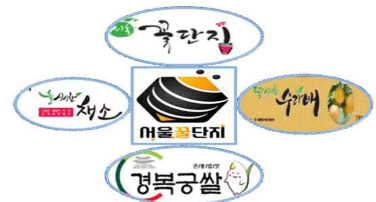
[서울 농산물 브랜드]