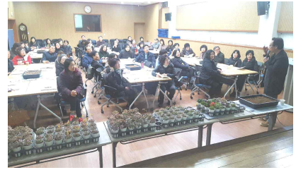
[원예활동 생활화 교육]