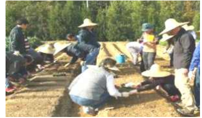
[채소 씨앗뿌리기 실습]