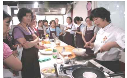
[쌀 이용 음식 실습]