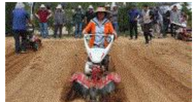
[보행관리기 운전 실습]