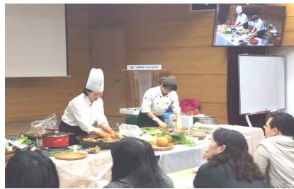
[제철 농산물 이용 교육]