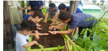
[초등학교 텃밭농장 운영]