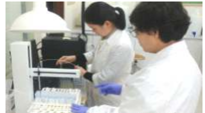
[토양성분 분석 작업]