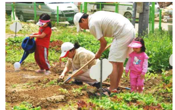
[다동이 농장 참여 시민]