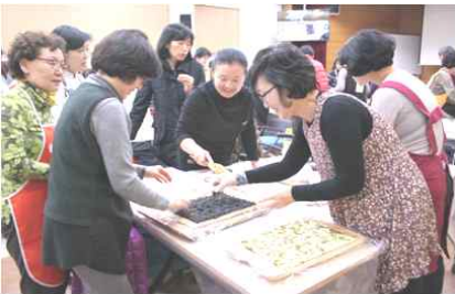
[전통강정 만들기 실습]