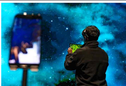
뉴미디어 기술 지원 XR-SAPY