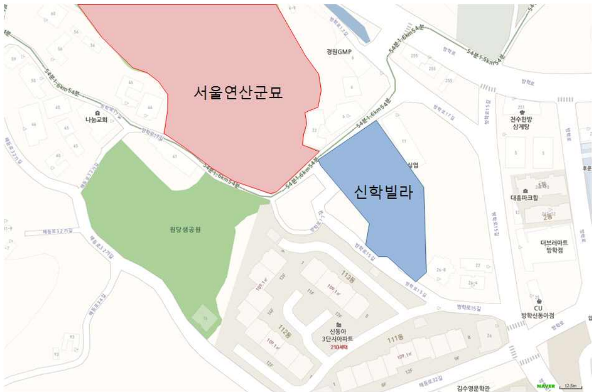
<그림 1> 도봉구 방학동 565번지 신학빌라 위치도