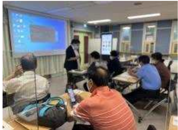
〈스마트폰알리미봉사단 전문·심화교육 〉