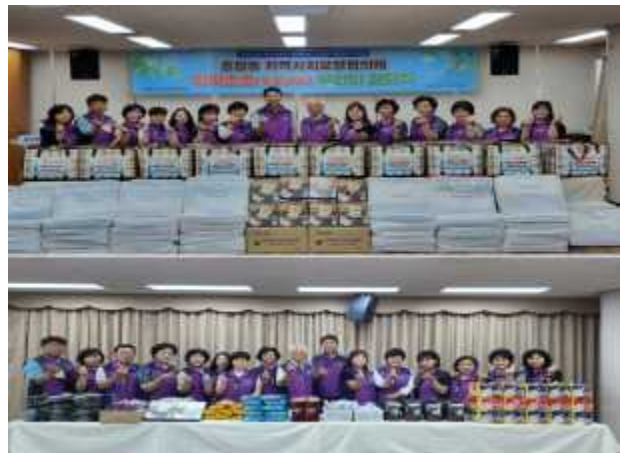
〈지역사회 네트워크 활성화 〉