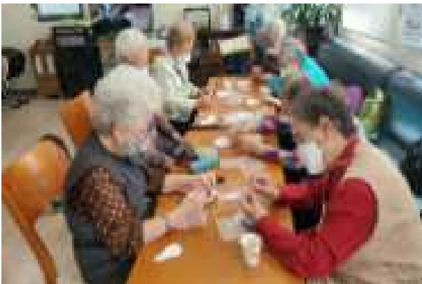
〈 경로당 여가 프로그램 〉