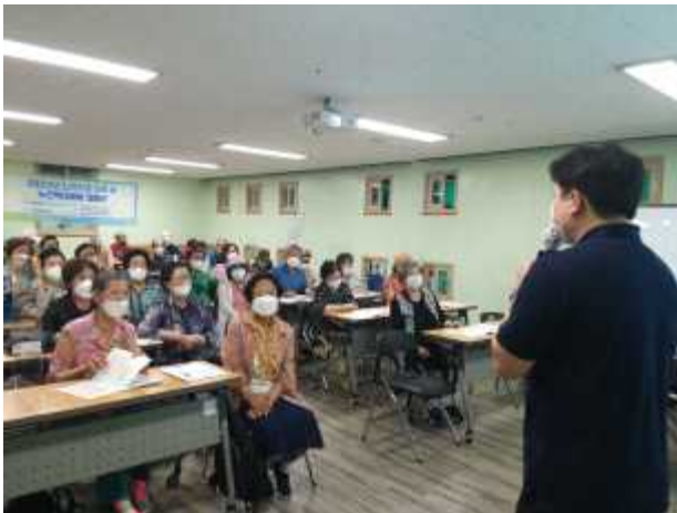
〈노인학대 예방 공개강좌 및 캠페인〉