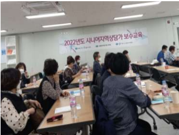
〈 시니어상담가 보수 교육 〉