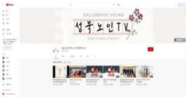
성북노인종합복지관 유튜브채널 “성북노인TV”