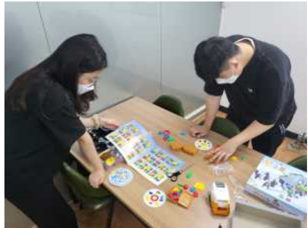
〈청년활동가 활동준비 2〉