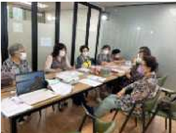
〈아랑하랑 세대이음 ‘학습 동아리’〉