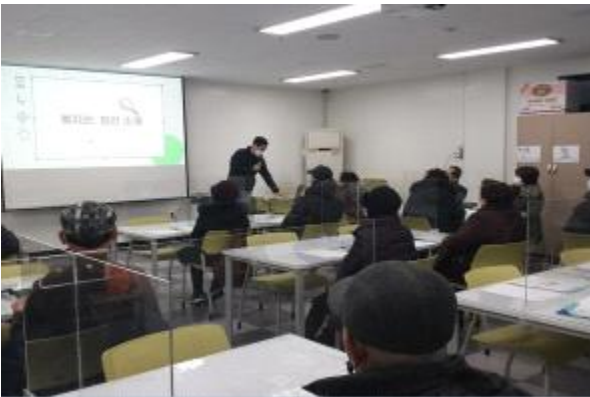
〈신입회원 이용안내 교육〉