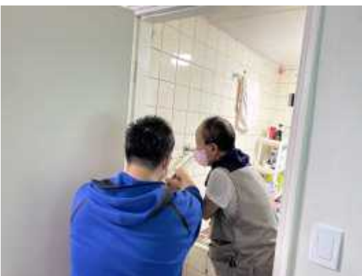
〈우리동네슈퍼맨 서비스 진행〉