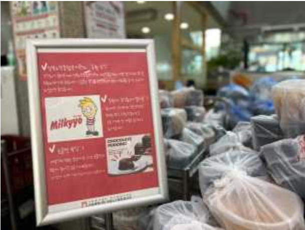
〈 후원자 감사 피드백 〉