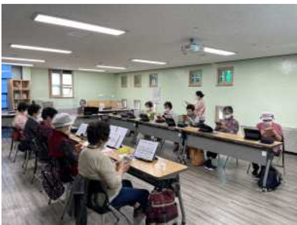
〈 취미여가 프로그램_칼림바〉