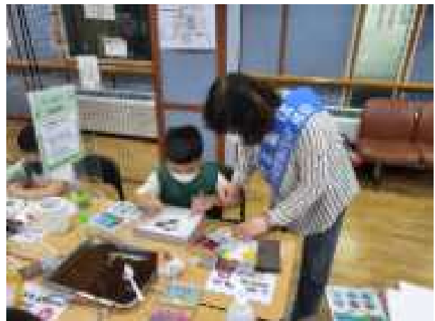
〈아랑하랑 세대이음 ‘선배시민 활동’〉