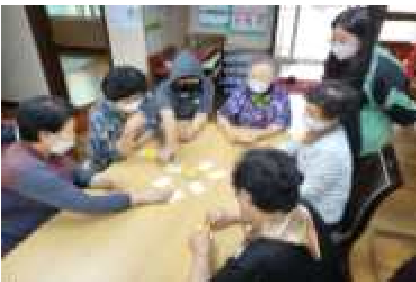
〈 경로당 세대 교류 프로그램 〉