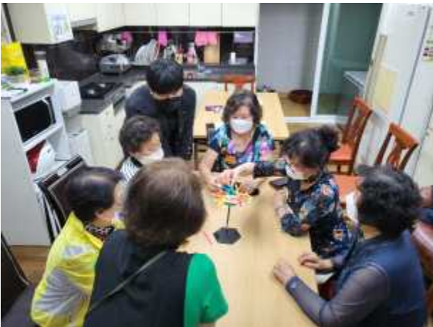
〈보듬이 활동 1〉