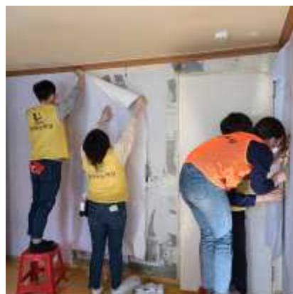
〈우리동네슈퍼맨 서비스 진행〉