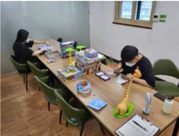
〈청년활동가 활동준비 1〉