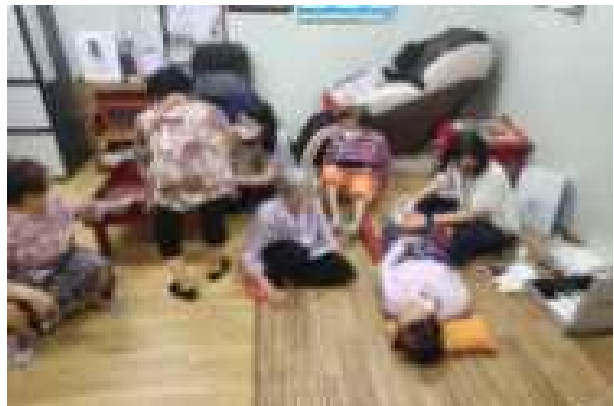
〈 경로당 방문 건강 진료 〉