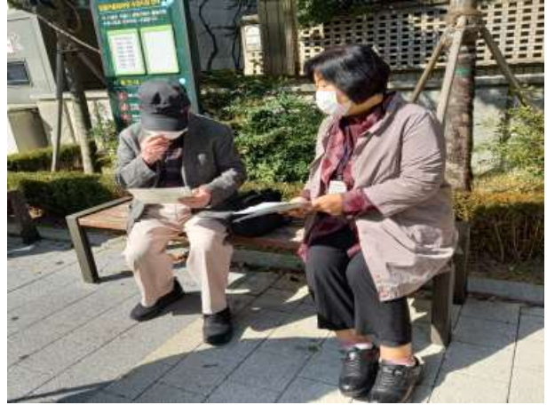
〈 시니어상담가 정보 제공 활동 〉