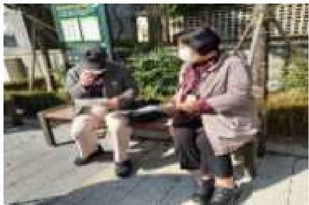
〈 시니어상담가 정보 제공 활동 〉