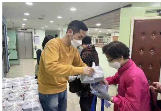
도시락, 밑반찬 전달