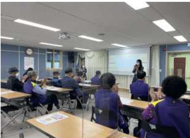
〈 은빛봉사대 간담회 〉