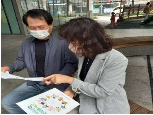
〈 시니어상담가 정보 제공 활동 〉