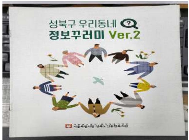
〈 정보꾸러미 소책자 〉