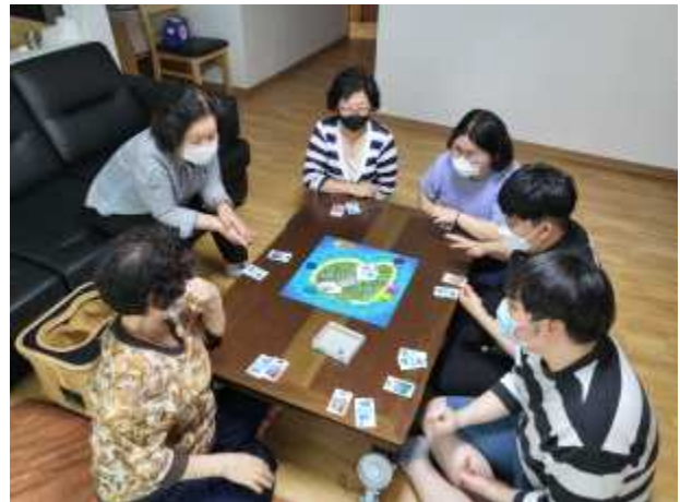
〈보듬이 활동 2〉