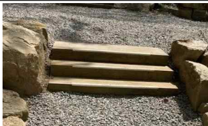
캠핑장 보행로 정비