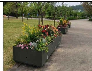
동물원 가는 꽃길