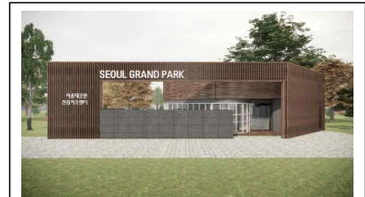
산림치유센터 조성 이미지