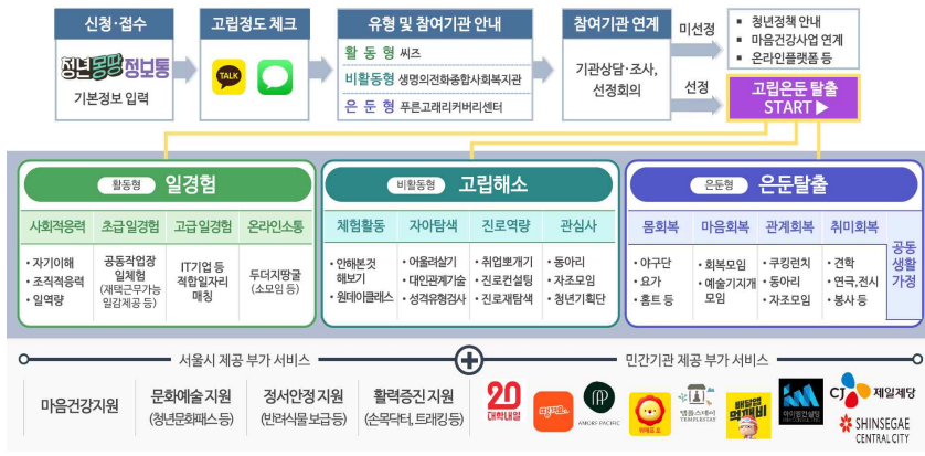
< 2023 고립·은둔 청년유형별 맞춤형 지원사업 흐름도 >