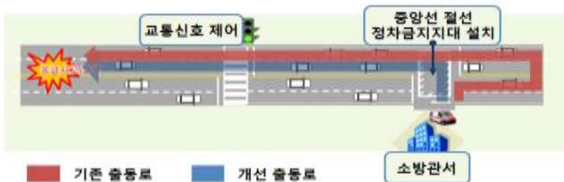
[그림] 종로소방서 임시청사 「교통신호 제어기」 설치 관련 현황