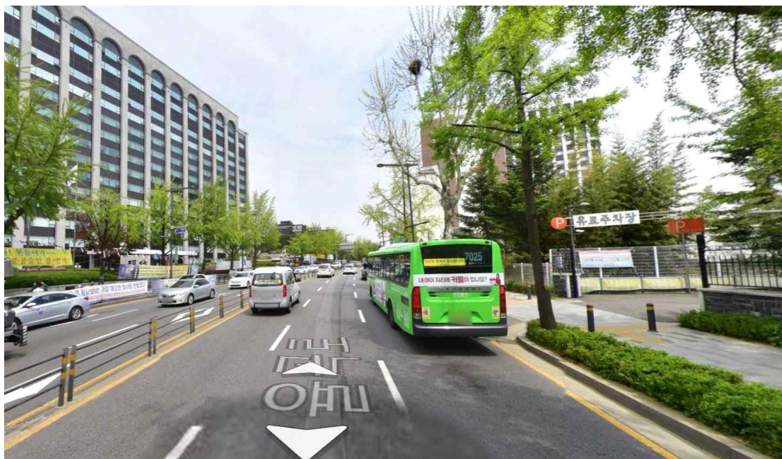
☞ 현재, 중앙분리대 및 교통신호제어기 미설치로 광화문 방향 출동 지연