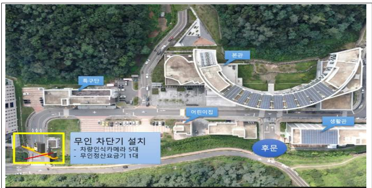
[표] 소방학교 주차차단기 설치 위치도(소방행정타운 정문)