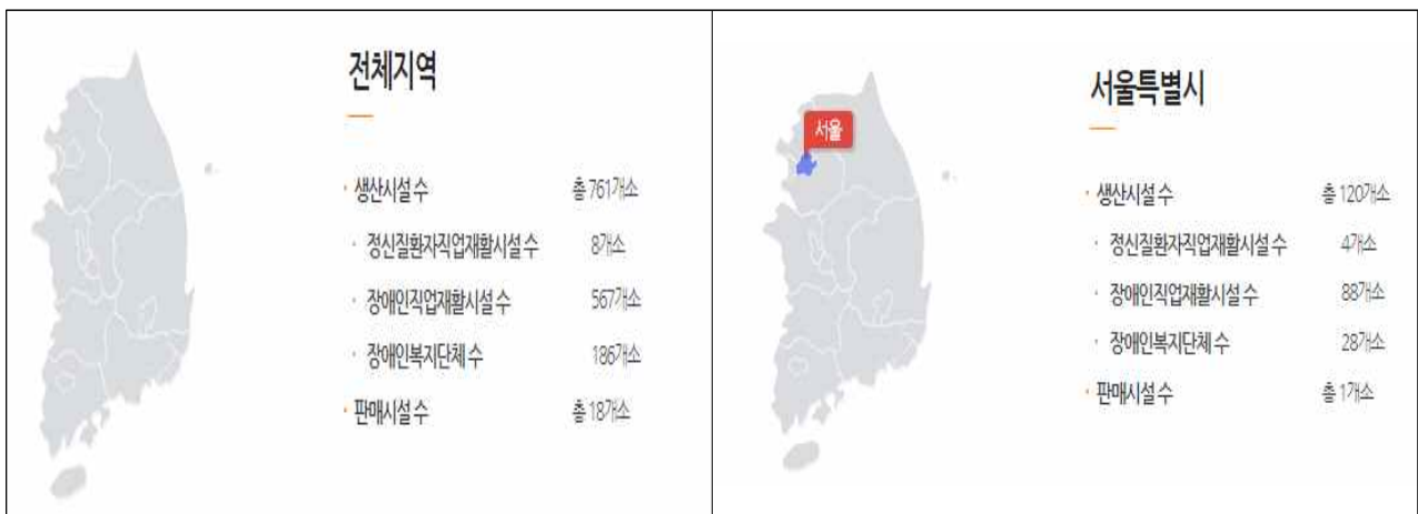
〈표 6〉 중증장애인 생산품 생산시설 현황