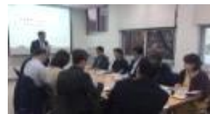
피드백 및 평가회