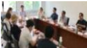
기획 및 모집