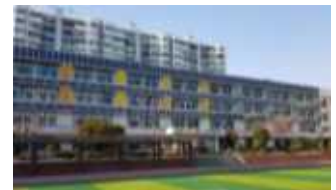
< 태양광설비(신사중) >