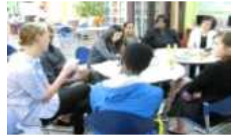
< 원어민보조교사컨설팅 >