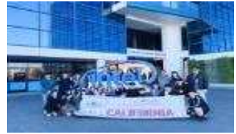
< 해외창의도시탐방 >