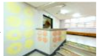
< 색채디자인(금양초) >