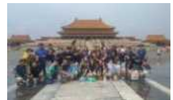
< 유라시아 체험단 >