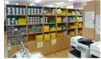
< 학습준비물센터(청량초) >