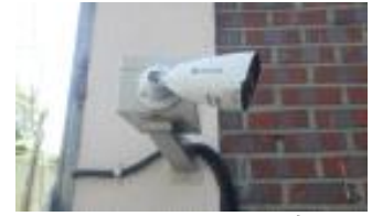
< CCTV 교체 >