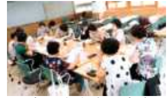
< 마을결합형도서관 >