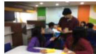
< 서울 영어·창의마을 >