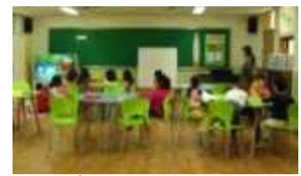
< 엄마품온종일돌봄교실 >