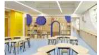
< 꿈을 담은 교실 >