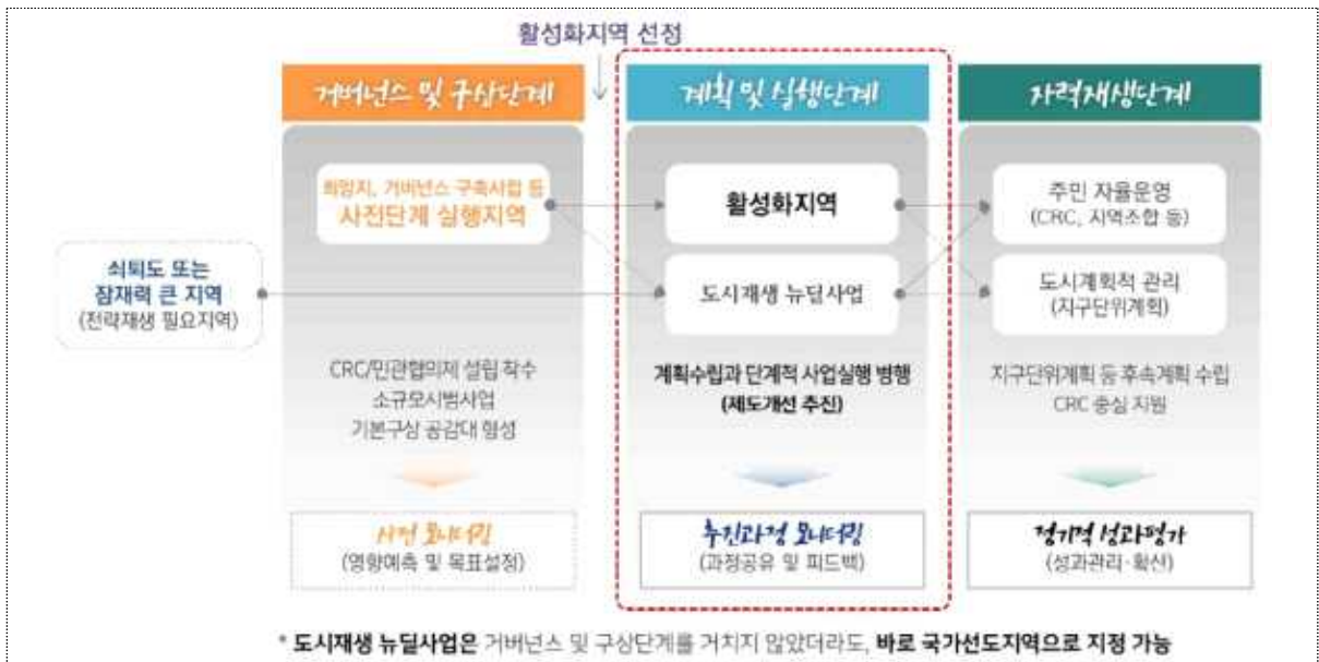
<활성화지역 3단계 운영 프로세스>