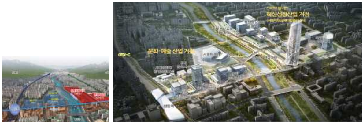
〈창동상계 일대 신경제중심지 육성 계획안〉