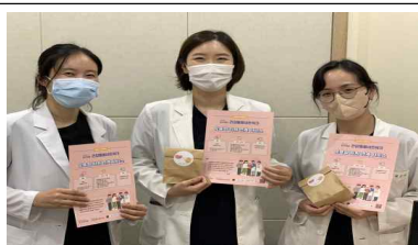
맞춤형 퇴원연계 서비스 관련 원내 의료진 홍보