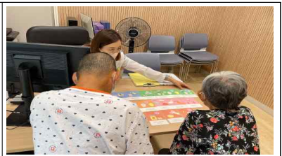
동네지원단 상담카드를 활용한 퇴원상담