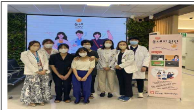
지역사회기관 네트워크 구축 활동(동대문구보건소)