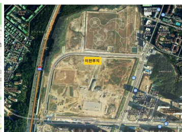
청사 이전 부지