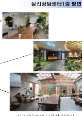
1층 배치도 평면