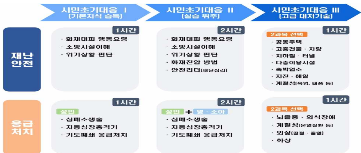
[그림] 시민안전기본교육 과정