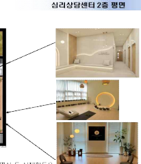
2층 배치도 평면