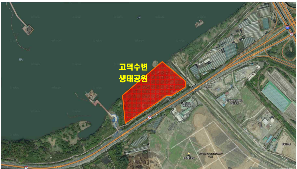
〈고덕수변 생태공원 현황〉