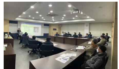
〈 관리감독자 교육 〉