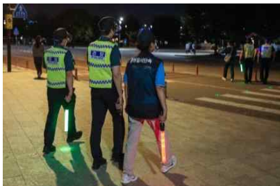
〈 방역수칙 위반행위 계도 〉