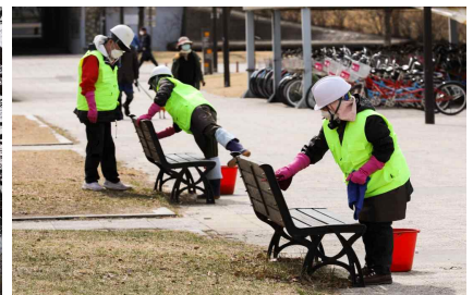
〈한강 일제 대청소〉