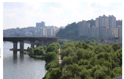
〈생태숲 조성 예시〉