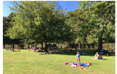
〈이용숲 조성 예시〉