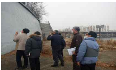
〈 시설 현장점검 〉