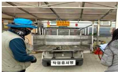
〈 사업장 안전보건 점검 〉