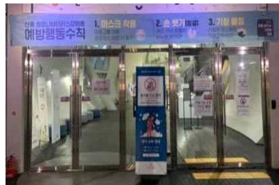
〈 방역수칙 안내 게시 〉