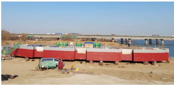
부유체(선박) 건조 도장(50×29×3m)