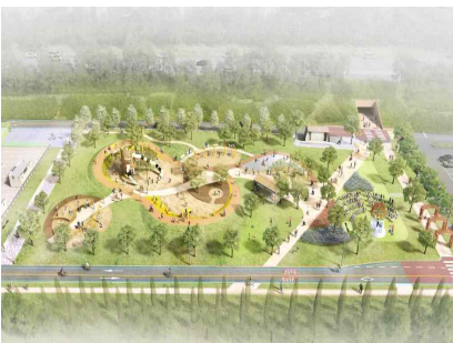
〈창의 어린이 놀이터〉