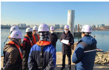
〈수상레포츠 통합센터 안전점검〉