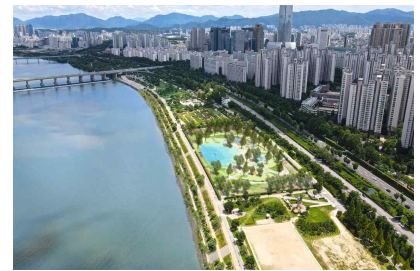
〈잠실 자연형 호안 조감도〉