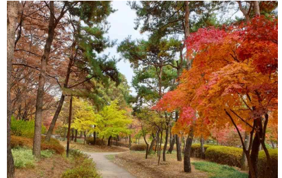
〈이용숲 조성 예시〉