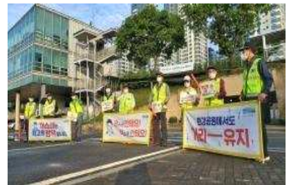
〈 시민 안전문화 캠페인 〉