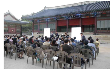
(서울) 친일문학 낭독 행사 ('17.5월)