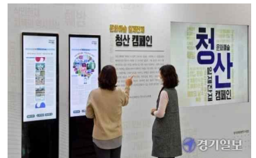
(경기) 문화예술 일제잔재 청산 캠페인 ('20.12월)