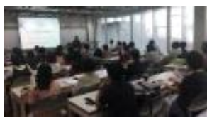
운영 및 모니터링