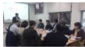
피드백 및 평가회