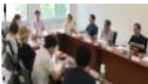
기획 및 모집