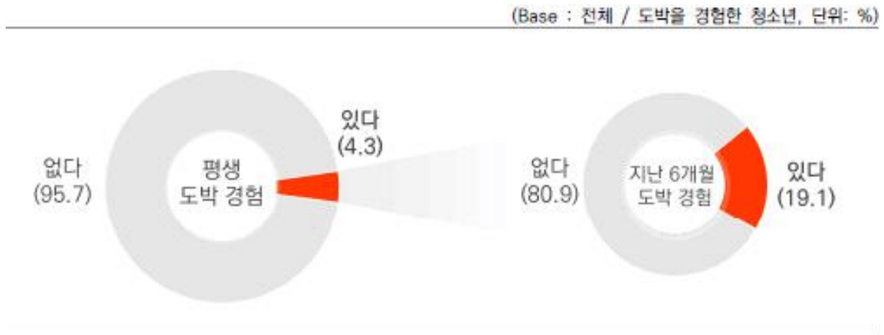
[표-1] 서울시 관내 초·중·고등학교 학생 도박 현황 (한국도박문제예방치유원 상담 접수 건) 7)