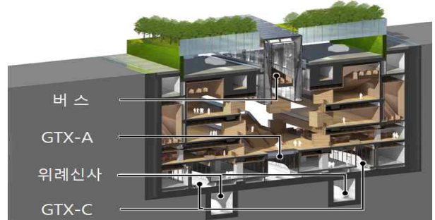
복합환승센터 건설 단면도