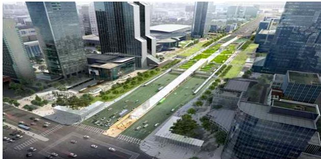
영동대로 복합개발 조감도