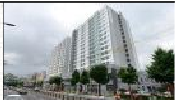
[사진 1] 외부 전경