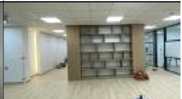
[사진 3] 내부 사진 2