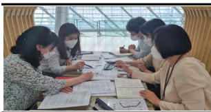
〈 유관부서 회의 〉