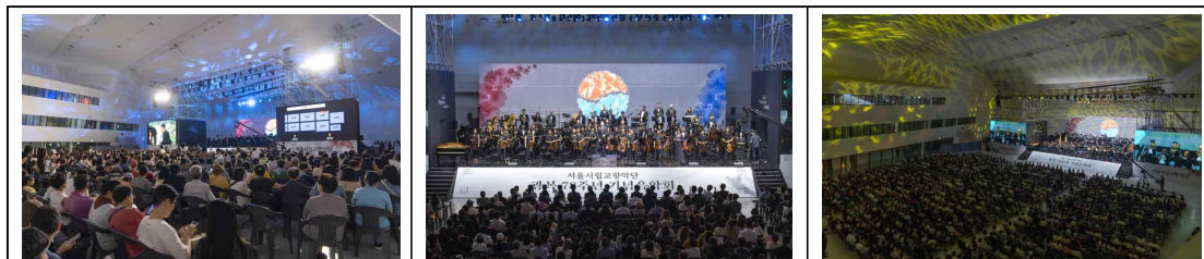
'23.8.15. 광복절 기념 음악회(DDP 아트홀)