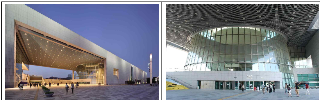
'23.8.26. 파크콘서트(국립중앙박물관 열린마당)