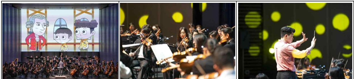
'23.5.2.&3. 키즈콘서트, LG아트센터 서울 시그니처홀