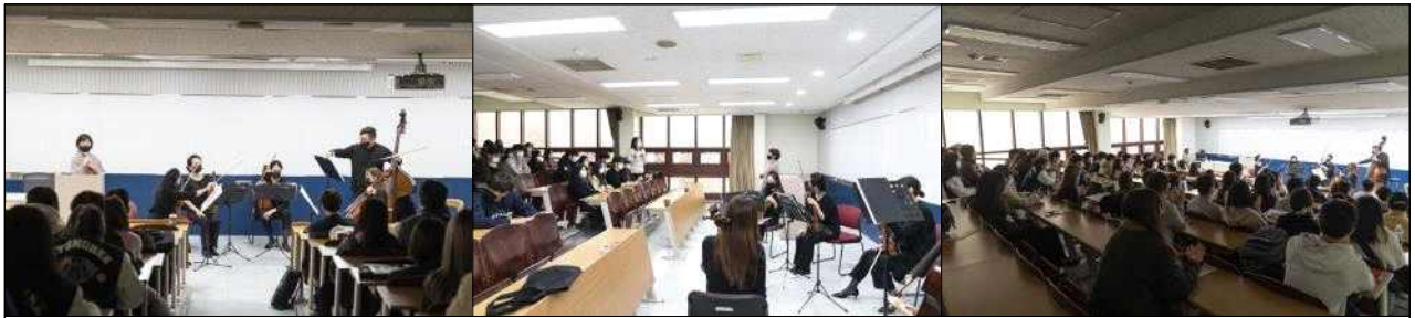
경희대학교 후마니타스 칼리지 교양강의('23년 1학기)