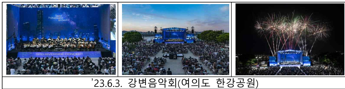
'23.6.3. 강변음악회(여의도 한강공원)