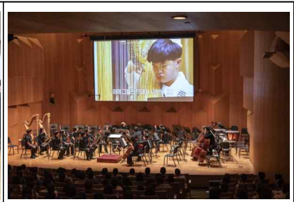
'23.6.1. 행복한 음악회, 함께!, IBK챔버홀