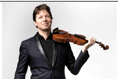
5월 협연 【조슈아 벨】