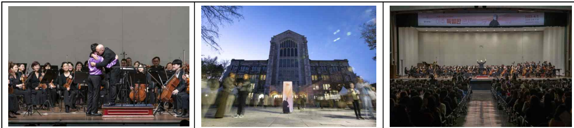
'23.4.7. 아주 특별한 콘서트(이화여자대학교 대강당)