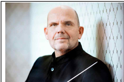
1·7·11·12월 지휘 【얍 판 츠베덴】