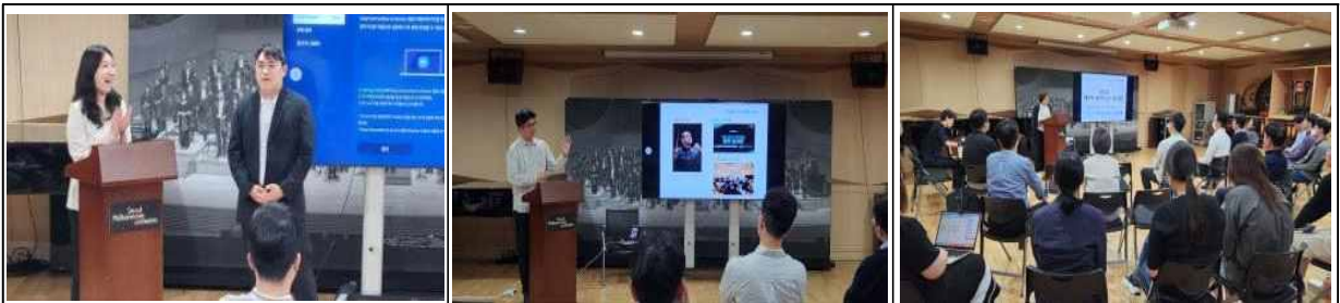
【'23년 비즈니스 콘서트】