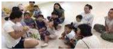
커뮤니티 활동 지원