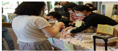
커뮤니티학교 시범 프로그램 운영