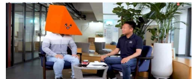
주제 중심 프로그램(온라인)