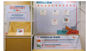
요구조사 창구 운영