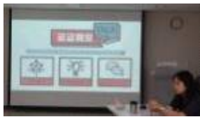
요구조사 프로그램 운영