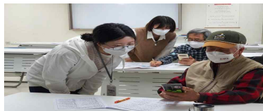
주제 중심 프로그램(오프라인)