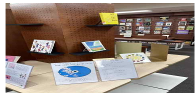
시민 북 큐레이션 지원