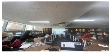
시민 주도 공간 운영