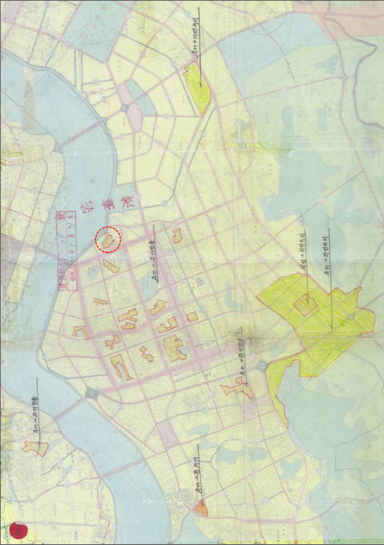
(강남구 영동지구 일원 도면)