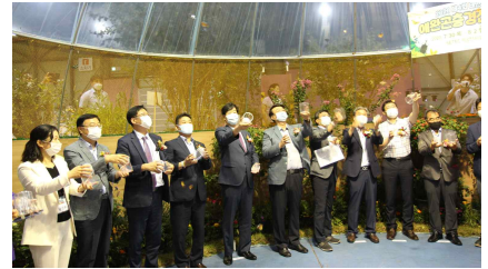
제4회 대한민국 애완곤충 경진대회 (개막식 “나비날리기” 행사)