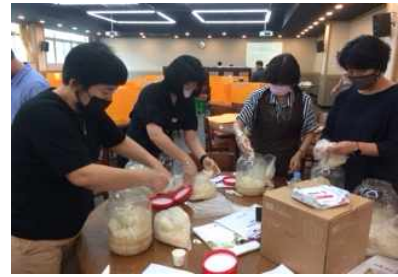
[쌀 이용 음식 실습]