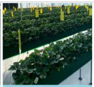
양어수조 연결용 배지경 재배