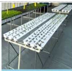
양어수조 연결용 박막식수경재배