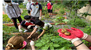
[초등학교 텃밭농장 운영]