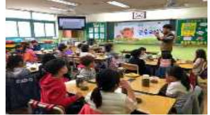
[정규 교과과정 연계한 '찾아가는 곤충교실']