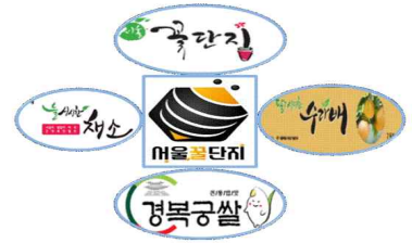
[서울 농산물 브랜드]