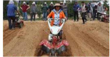
[보행관리기 운전 실습]