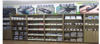
[곤충체험 관련 매장]