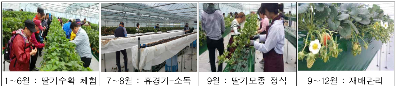
1~6월 : 딸기수확 체험