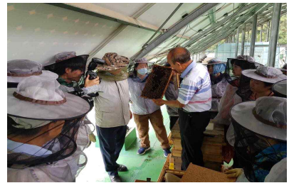
[곤충산업 전문인력 양성교육]