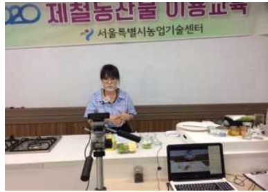
[제철 농산물 이용 교육]