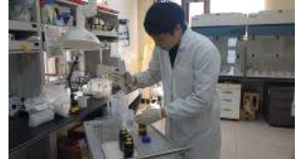
[토양성분 분석 작업]