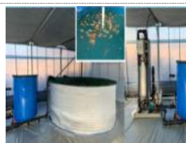
센터 내 아쿠아포닉스 231 m^2