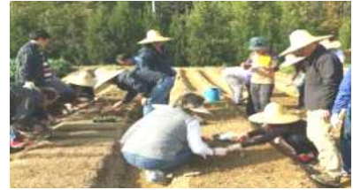
[채소 씨앗뿌리기 실습]