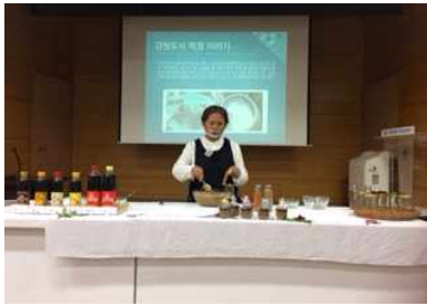
[전통장 담그기 교육]