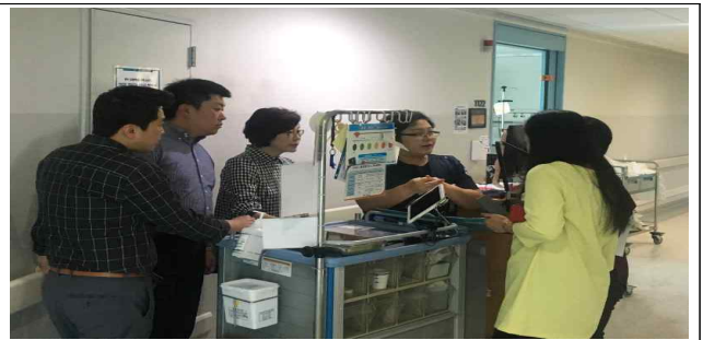
선도병원 역할 수행