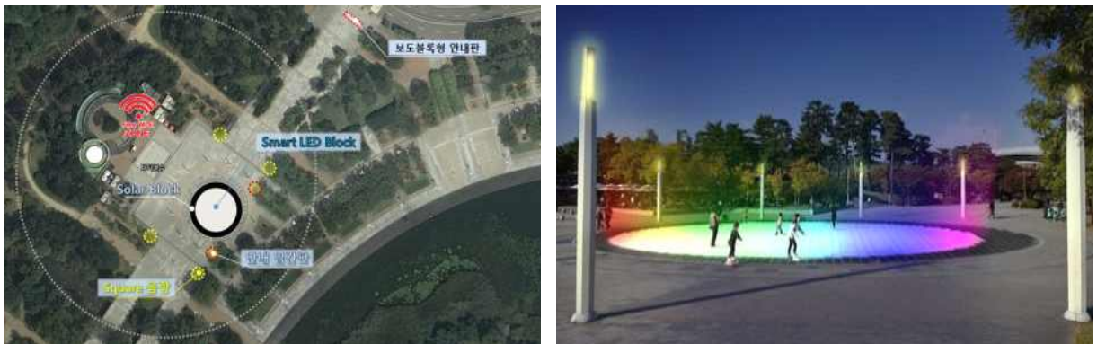
〈월드컵공원 Solar Square〉

또한, 변경사용을 통해 신규 추진하는 ‘태양광 랜드마크 조성’이 「공공시설 신재생에너지 보급 5) 」 사업의 목적에 맞는지, ‘태양광 랜드마크’ 조성의 일환으로 월드컵공원과 뚝섬한강공원 내에 각각 바닥형 LED영상 연출시설 (Solar Square)과 자전거도로(Solar Road)를 설치(’19.10월 준공예정) 하였는데, 과연 자전거도로 설치 등이 ‘태양광 랜드마크’ 조성의 방법으로 적절한 것인지에 대해서는 논의가 필요할 것임.