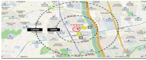
위 치 도