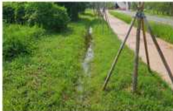
<그림 4> 자연정화 잔디수로(자연정화시설)