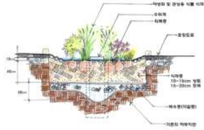
<그림 3> 소규모 저류녹지 모식도