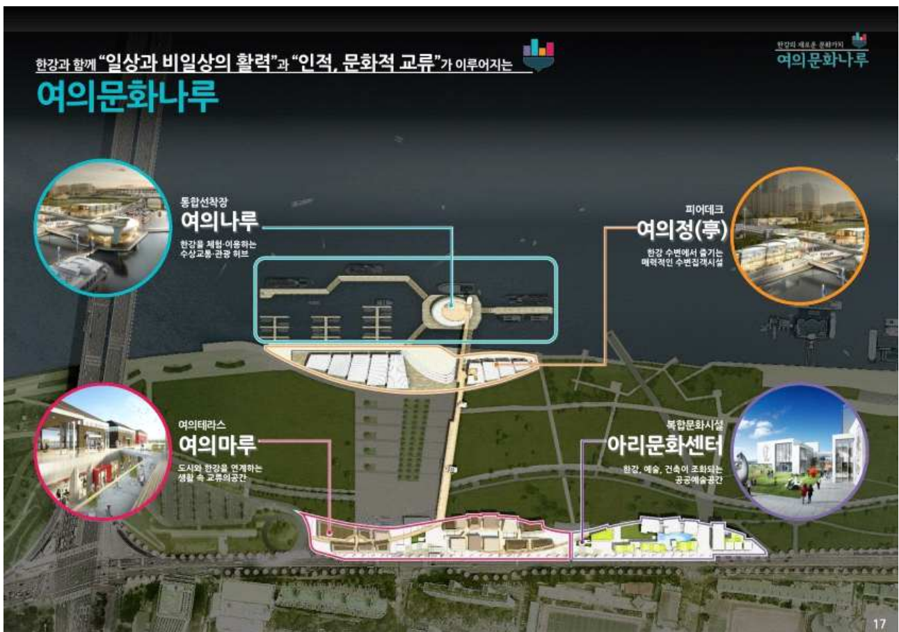
<그림 5> 한강협력 4대사업 배치도