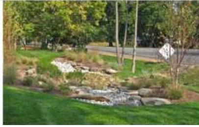
<그림 2> 소규모 저류녹지 사례