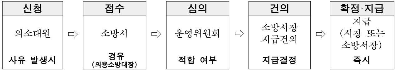
[그림 1] 현행 재해보상금 지급 순서도