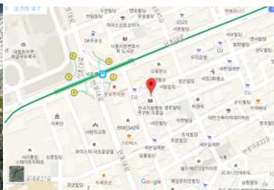
위 치 도