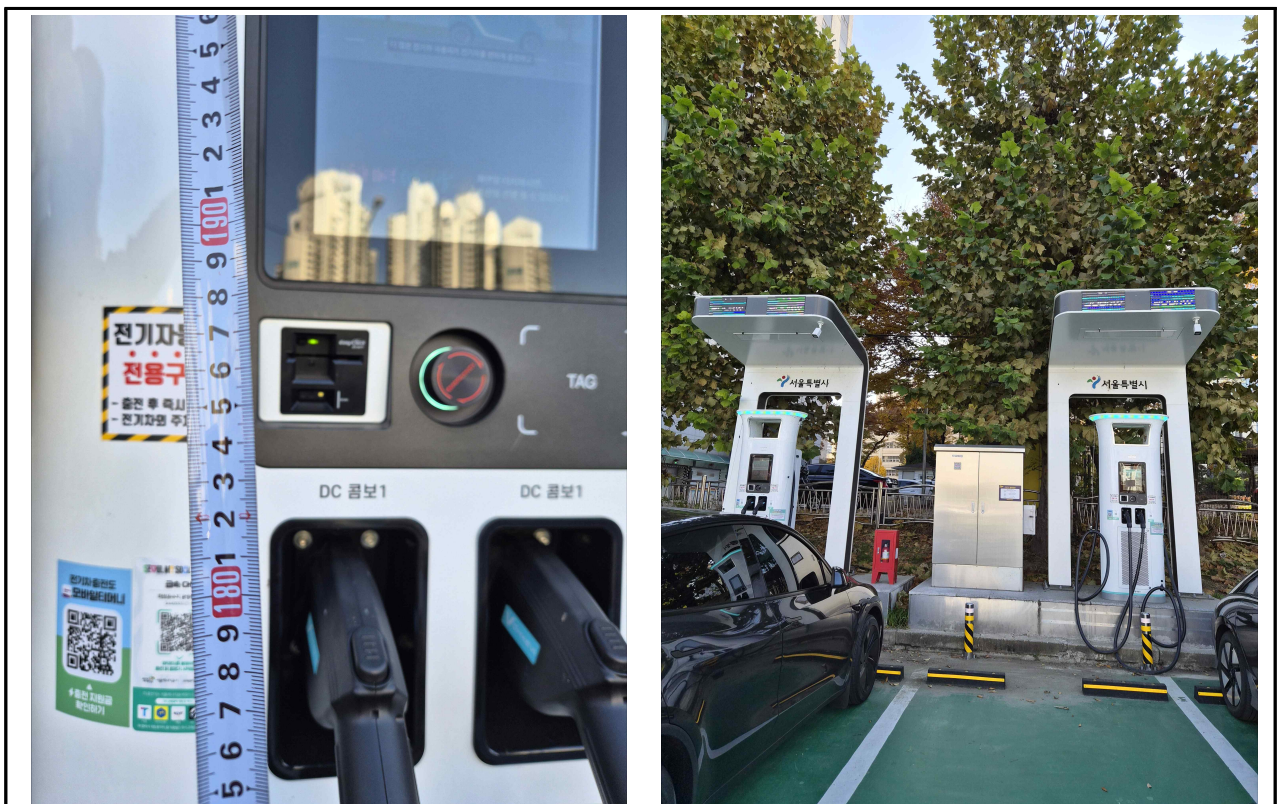
※ 마포유수지공영주차장 내 서울에너지공사 전기차 급속충전기