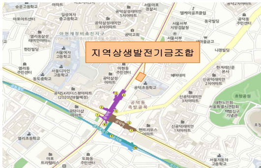
<위 치 도>